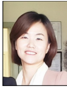
유니스 전 관장

저희 봉사회는 특성상 여러 다양한 기능이 요구되는 기관입니다. 우선 한인분들의 어려움을 파악하고, 그 문제를 지원해드리는데 발빠른 대처가 필요합니다. 봉사회는 2년 반전, 처음 펜데믹이 시작되고, 자택대기명령이 내려진 2주를 제외하고는 매일 오피스를 열고 비상 사태에 필요한 건강 정보 안내, 마스크 및 소독제, 아시안 혐오범죄 대응 가이드 북 및 알람기계 등을 지속적으로 지원해 드리고 있습니다. 또한 대부분의 시니어들의 고립이 장기화되고 식사 및 장보기 등의 어려움이 극해지자, 펜데믹 시작 후 처음 몇 달은 매일 시니어 점심 도시락을 120개씩 싸서 시니어 아파트에 배달까지 해드리며 어려움을 함께 극복해 나가실 수 있도록 도움이 드렸습니다. 그 후에도 특별한 어려움에 처한 분들께는 긴급간병인 지원 서비스를 현재까지 제공하고 있습니다. 또한 지속되는 펜데믹으로 외로움과 고립감 등을 호소하는 분들이 늘어나 몇 달 전부터는 시니어 웰니스 프로그램을 오픈하여 시니어분들이 함께 모여 육체적 정신적 건강을 향상시킬 수 있는 프로그램 등을 제공해 오고 있습니다.