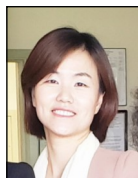
유니스 전 관장

2022년 한 해가 어느새 한달만 남겨놓고 있습니다. 12월 소식지 인사말을 준비하며 작년 이맘때쯤에 어떤 인사말을 썼었는지 찾아보고 참으로 놀랍고 감사한 일이 올해 있었구나라는 것을 새삼 다시 깨닫게 되었습니다. 작년 이맘때쯤에는 봉사회 구관 계약 종료가 다가오고 있었으나, 새로운 장소를 아직 찾지 못한 상황이어서 저뿐만 아니라 이사님들, 직원분들, 그리고 특히 많은 회원분들이 걱정을 하고 있었습니다. 봉사회 걱정으로 잠을 못 이루신다는 회원분들의 말씀이 너무나 마음이 아프기도 하였습니다.